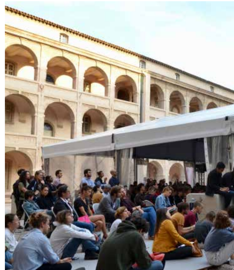
FESTIVAL « ALLEZ SAVOIR » ORGANISÉ PAR L'EHESS À MARSEILLE

Le résultat de la collaboration devra être présenté à l'EHESS et à Camargo pendant la résidence.