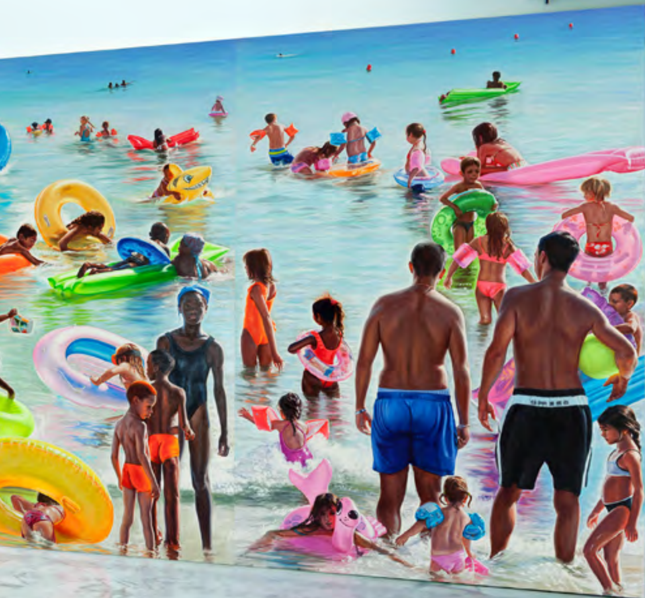
Le Pont , MAC Marseille 2013, Installation ( The Bathers , 2009, oil on canvas, 300 x 620 cm)