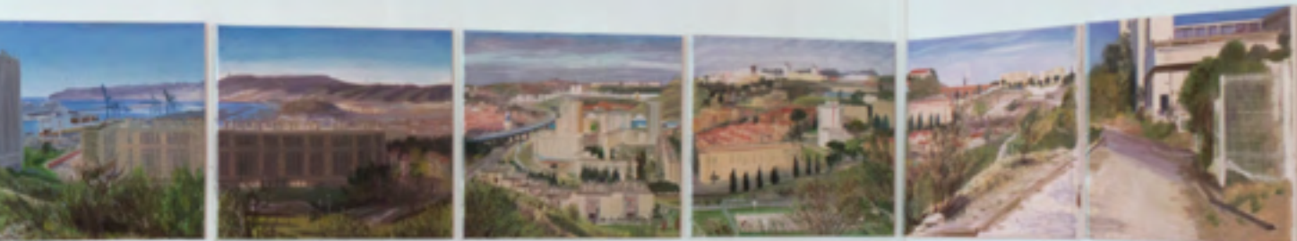
Quartiers nord: Colline Consolat, panorama seen from the public park Séon (Simulation)