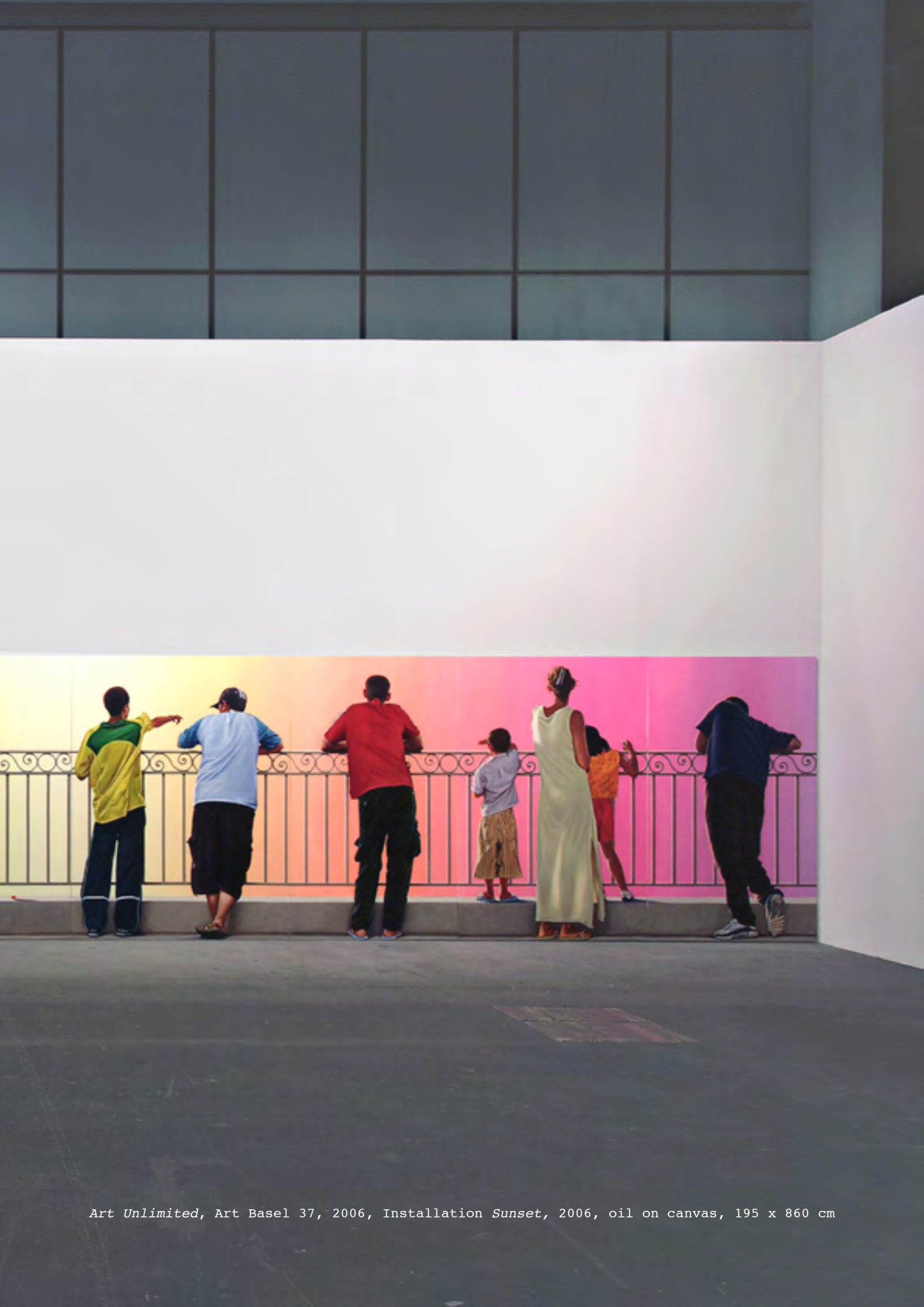
Art Unlimited, Art Basel 37, 2006, Installation Sunset, 2006, oil on canvas, 195 x 860 cm