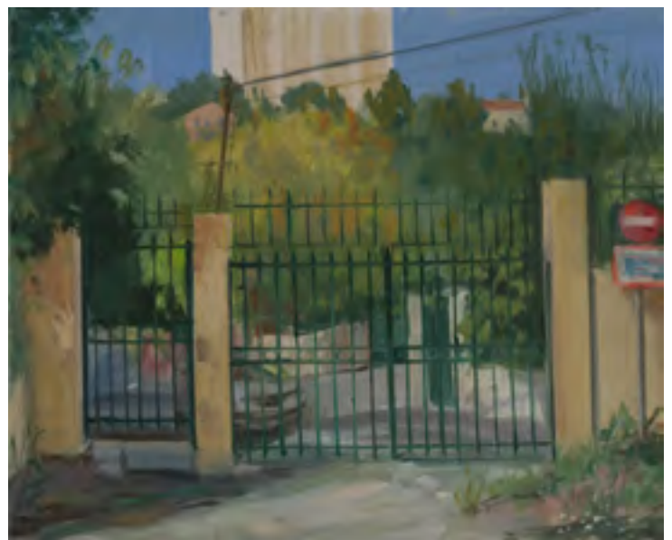
Gates: rear entrances of the gated communities in the 8. arrondissement Entrées Rue Flotte , 2014, oil on canvas, 5 panels, 38 x 46 cm each