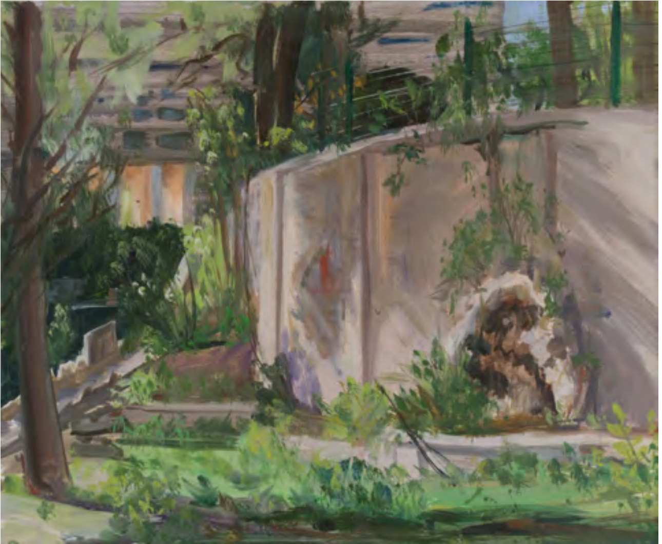
Romantic ruins: decrepit remains of the former bastide

Résidence Flotte , 2014, oil on canvas, 3 panels, 38 x 46 cm each