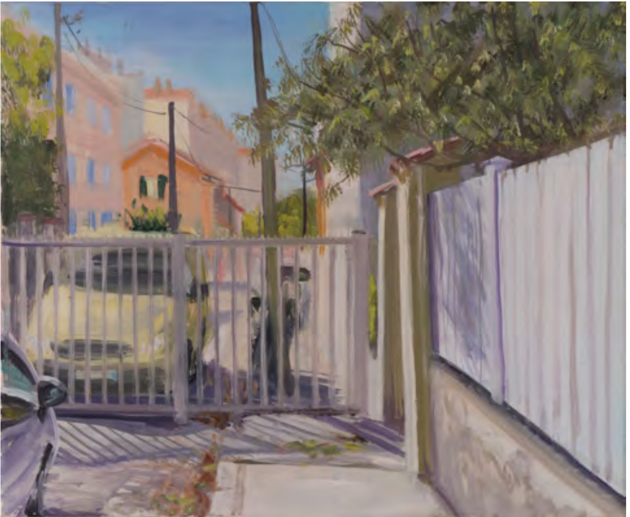
Fences without gates: bisected road in the Quartiers Sud Coin Joli , 2017, oil on canvas, 3 panels, 38 x 46 cm each