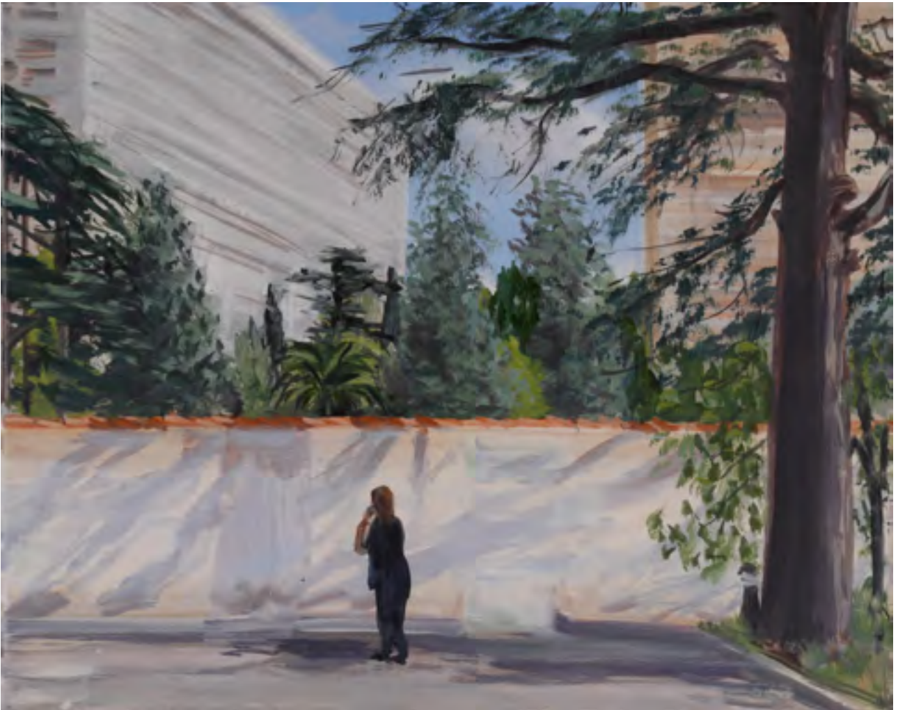
Europe's largest gated community, with remains of the former bastide La Rouvière , 2014, oil on canvas, 6 parts, 33 x 41 cm each