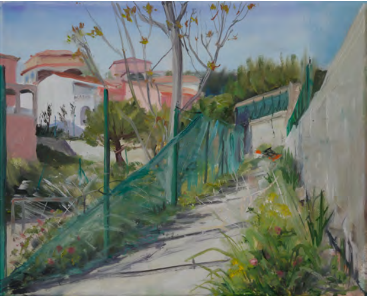
New gated community behind Europe's poorest Cité, Parc Kallisté Val aux Grives , 2017, oil on canvas, 2 parts, 33 x 41 cm each