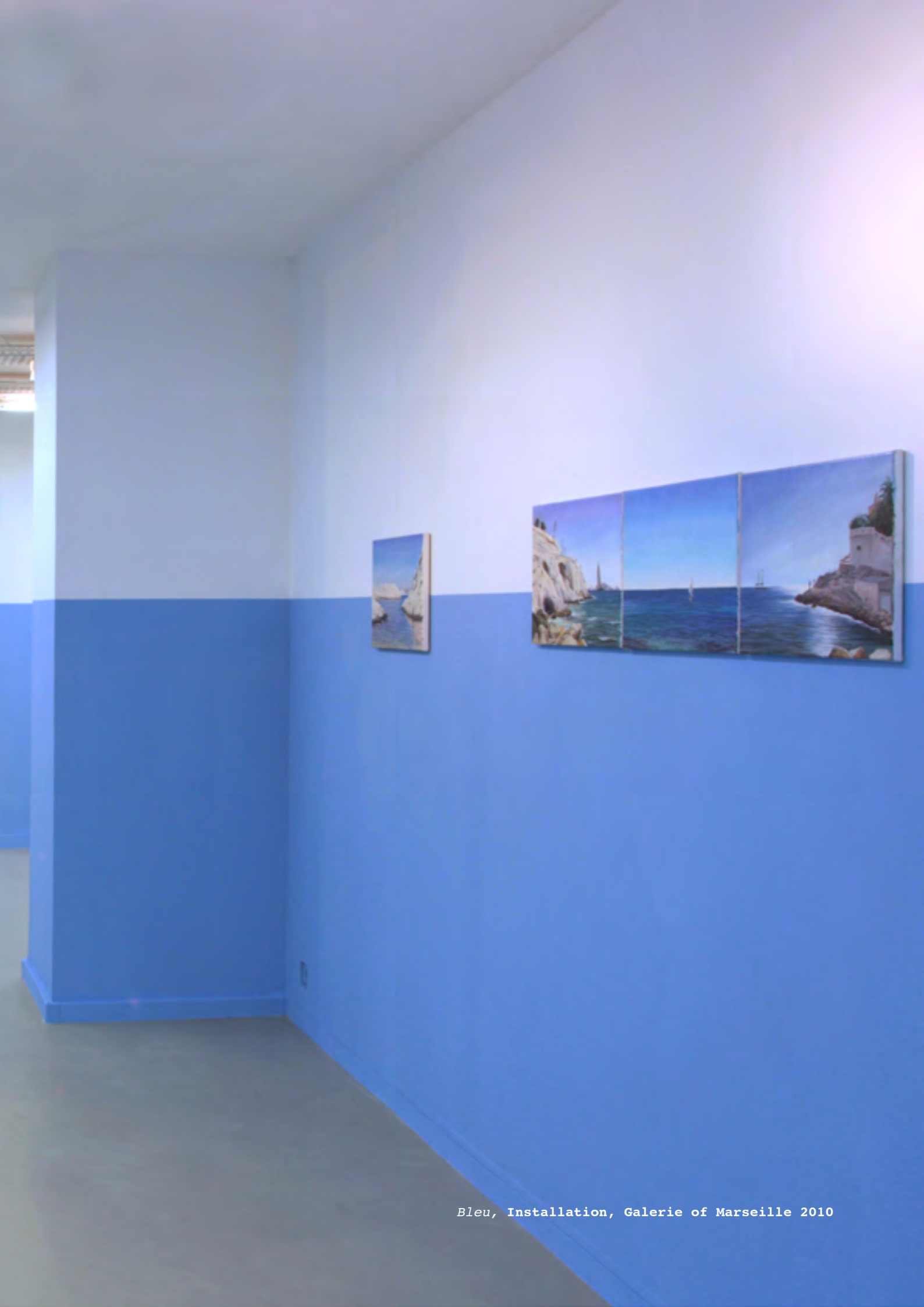
Bleu, Installation, Galerie of Marseille 2010