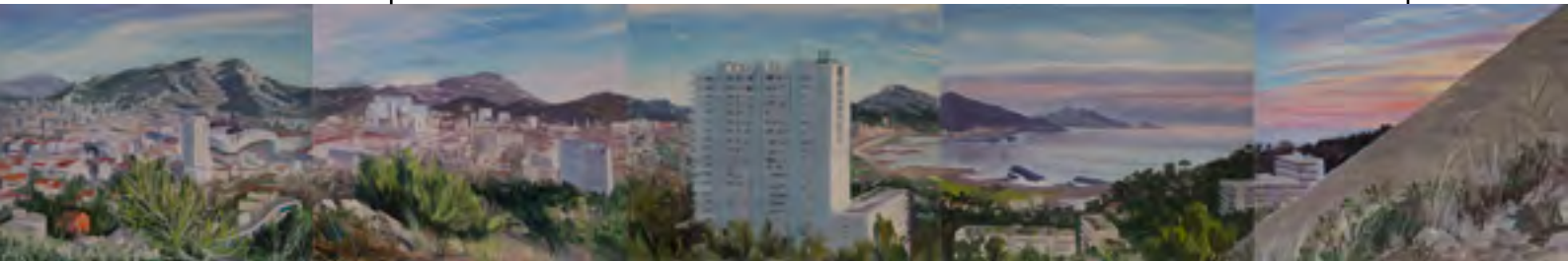
Résidence Le Thalassa