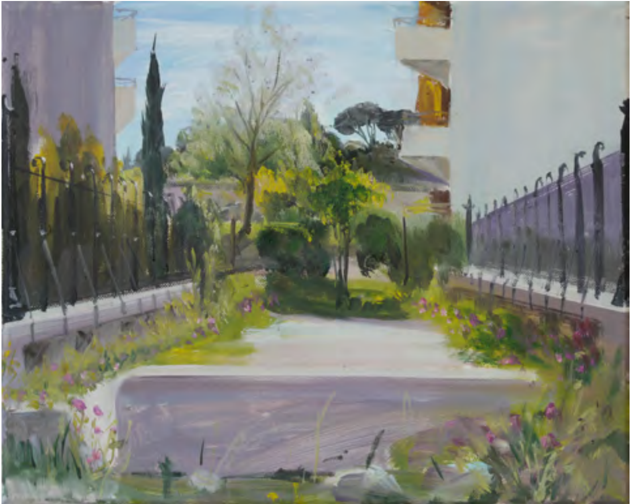
Quartiers Nord, newly built gated community